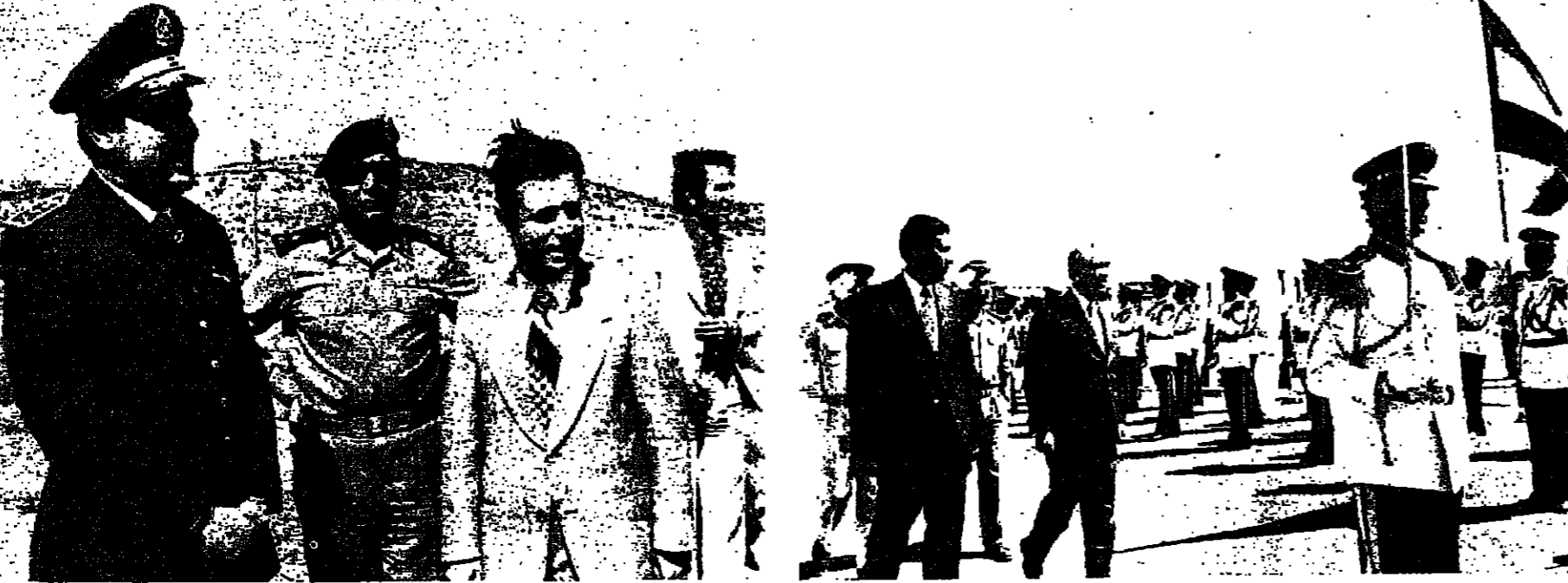
الرئيس كرامي يستعرض جرس الشرف عند الحدود السورية وفلسطين رئيس الحكومة السورية السيد محمود الابويي

واضاف: لقد اخذت مصر عندي وجدت ان حدة القرار قد لا تحظى بالقيود المطلوب على الصعيد العالمي، درجة اقل من الحدة يمكنها ان تؤمن اجماعاً حول هذا القرار، والجميع يتردد ان مصر هي التي قامت بالدور الاساسية في مؤتمر الرباط لتفخالا قرار طرد اسرائيل، وقد نلت لها في هذه القمة الاساسية. وفي القمة الاقليمية، قامت مصر بالدور الاقليمي الى قرار مماثل في الامم المتحدة في الشكل اقل حدة، لانها ارادت ان تعود اجماعاً لا تفرق. ويذكر الجميع ان مصر هي التي قامت عملية تفرض العزلة الدولية على اسرائيل وكثرت في حركتها النشطة هذه تتلقى في ظهرها سهام التشكيك من الذين يتكلمون ببنحانهم وحسب، عندهم كانوا يريدون ان اي عمل سياسي لا يجري منه، وان اية حركة سياسية تقوم بها مصر تكون على حساب المعركة، كما ادعو، فلماذا غيروا رأيهم اليوم وصاروا يتحذرون بالسياسة؟